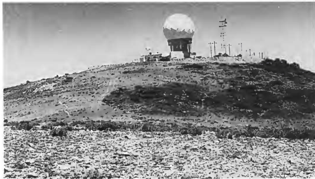
Fig. 1. Panorámica de la cima del Cerro Potosí. En primer plano pradera alpina. Parte alta: instalaciones de la Secretaría de Comunicaciones y Transportes.

El Cerro Potosí forma parte de la Sierra Madre Oriental al sur del estado de Nuevo León. Alcanza una altitud de 3670 m s.n.m. y representa la cima de mayor altura del norte de México. Su aislamiento geográfico y diferencias en el sustrato geológico con respecto al de otras altas montañas determinan la existencia de un alto porcentaje de especies endémicas (Rzedowski, 1978). La zona está fuertemente afectada por disturbio antropogénico, principalmente construcciones realizadas por la Secretaría de Comunicaciones y Transportes, así como por incendios y pastoreo (Fig. 1).